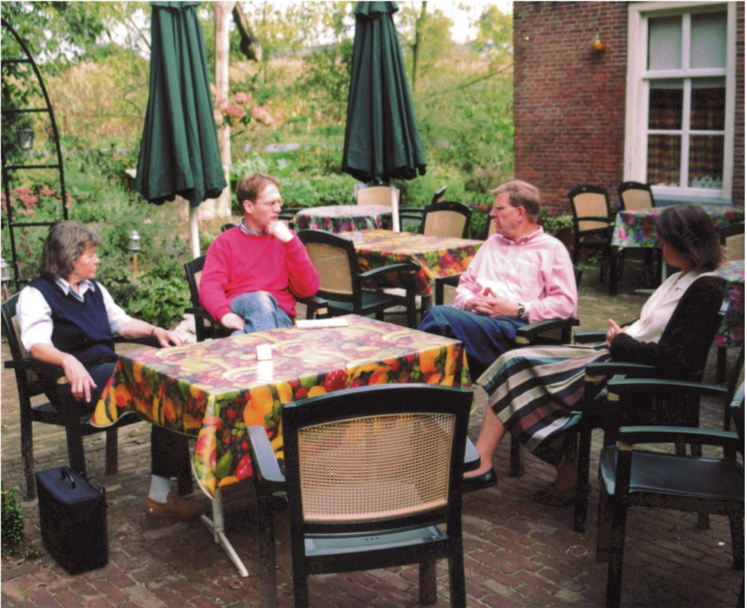
Fietsexcursie naar de molen van Diepenheim.