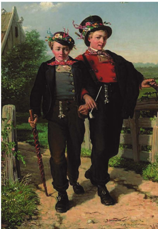
Afb. 5. "De brulftenneugers", Twentse fraai uitgedoste uitnodigers voor een bruiloft die beiden een signetketting dragen, geschilderd door H. Valkenburg. Herkomst: Collectie Oudheidkamer Twente