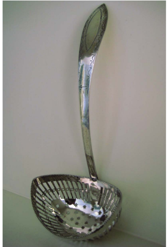
Afb. 3. Strooilepel, Reinier Brugman, Ootmarsum 1820. Merken: meesterteken (twee verschillende meestertekens afgeslagen) RB29 in vierkant en B in gearceerd vierkant, jaarletter voor 1820, kantoorkeur Zwolle en gehaltemerk. L. 18 cm, bak 7,2 x 5,2 cm. Herkomst: Part. Collectie

Jelis Wientjes, die zich ook wel uitgaf als “Egidius” aangezien het in die tijd vaker voor kwam dat een naam verfraaid werd door deze te verlatiniseren [6], was in 1795 meesterzilver-smid geworden in Groningen [7] en is rond 1800