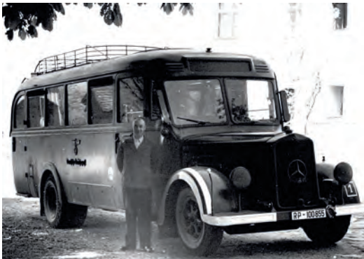
Bus Tötungsanstalt Hartheim.