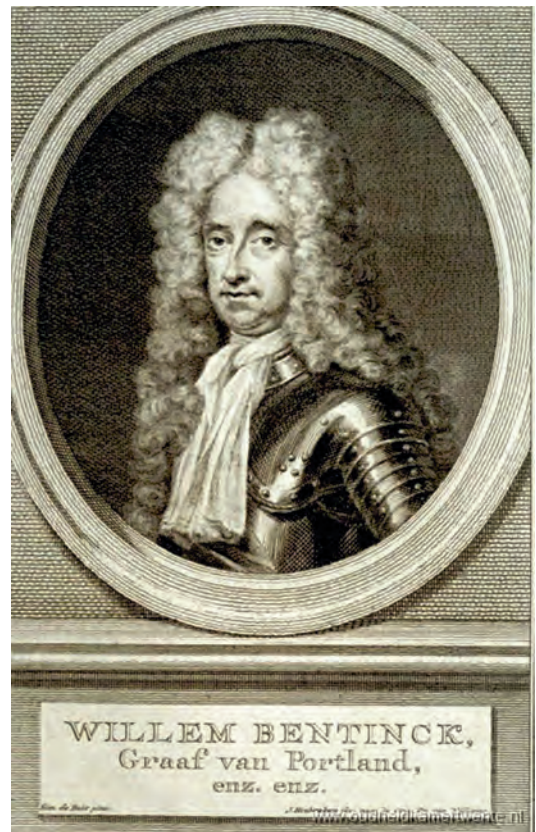
Hans Willem Bentinck

In 1675 kocht Hans Willem het landgoed Sorghvliet bij Den Haag, waar het Catshuis deel van uitmaakte. Toen Willem dat jaar werd getroffen door pokken bleef Bentinck zestien dagen en