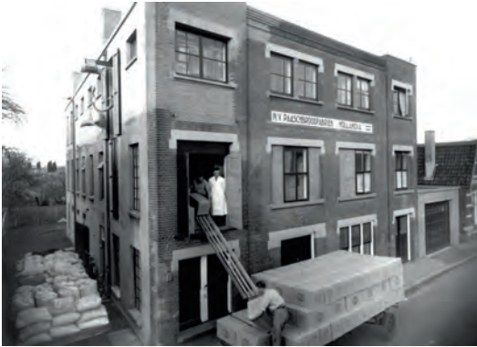
Paaschbroodfabriek Hollandia, na de oorlog

die ze daarvoor aandraagt laten echter zo weinig ruimte voor twijfel, dat we het woordje ‘vermoedelijk’ gerust kunnen weglaten.