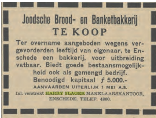
Advertentie Algemeen Handelsblad, 18 januari 1941: “Joodsche Brood- en Banketbakkerij te koop”