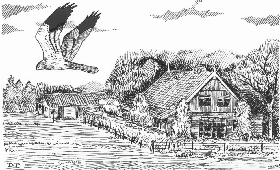
Grauwe kiekendief, mannetje.